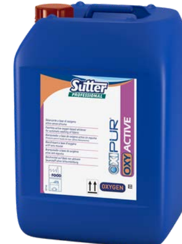
OXI ACTIVE Професійний кисневий відбілювач