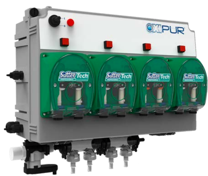
Система дозування рідких миючих засобів SMART · Дозування до 6 різних продуктів рідкої хімії · Використання до 20 професійних програм