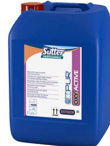
OXI ACTIVE Професійний кисневий відбілювач