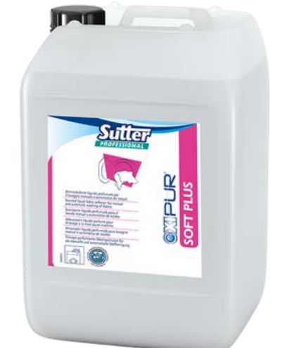
SOFT PLUS Професійний кондиціонер-нейтралізатор