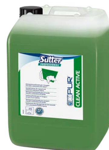
CLEAN ACTIVE Високо-концентрований підсилювач прання