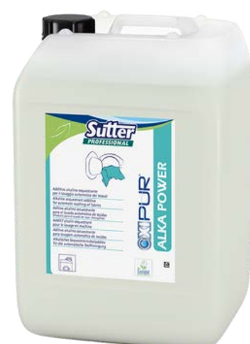
ALKA POWER Лужний засіб для попереднього та основного прання