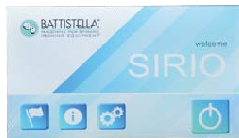
Сенсорная панель управления